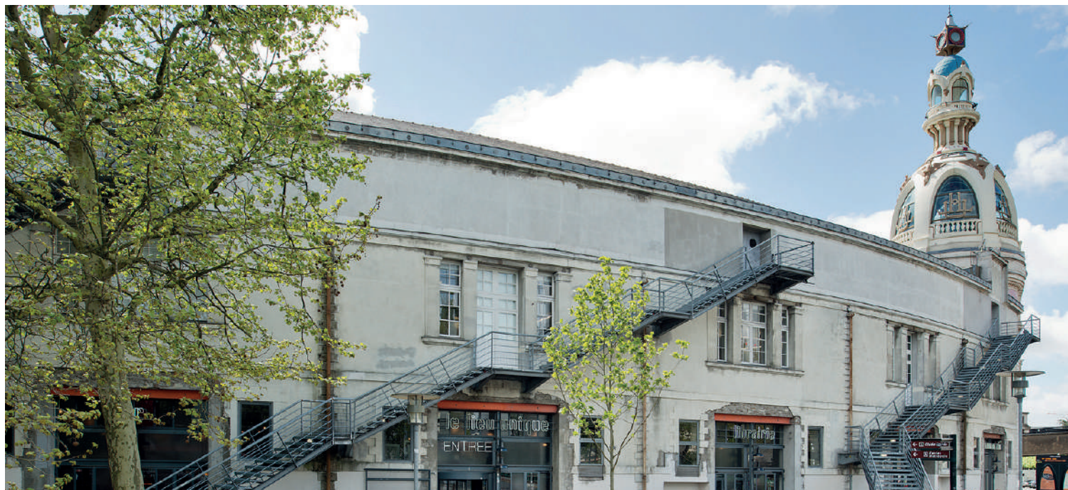
Le Lieu Unique