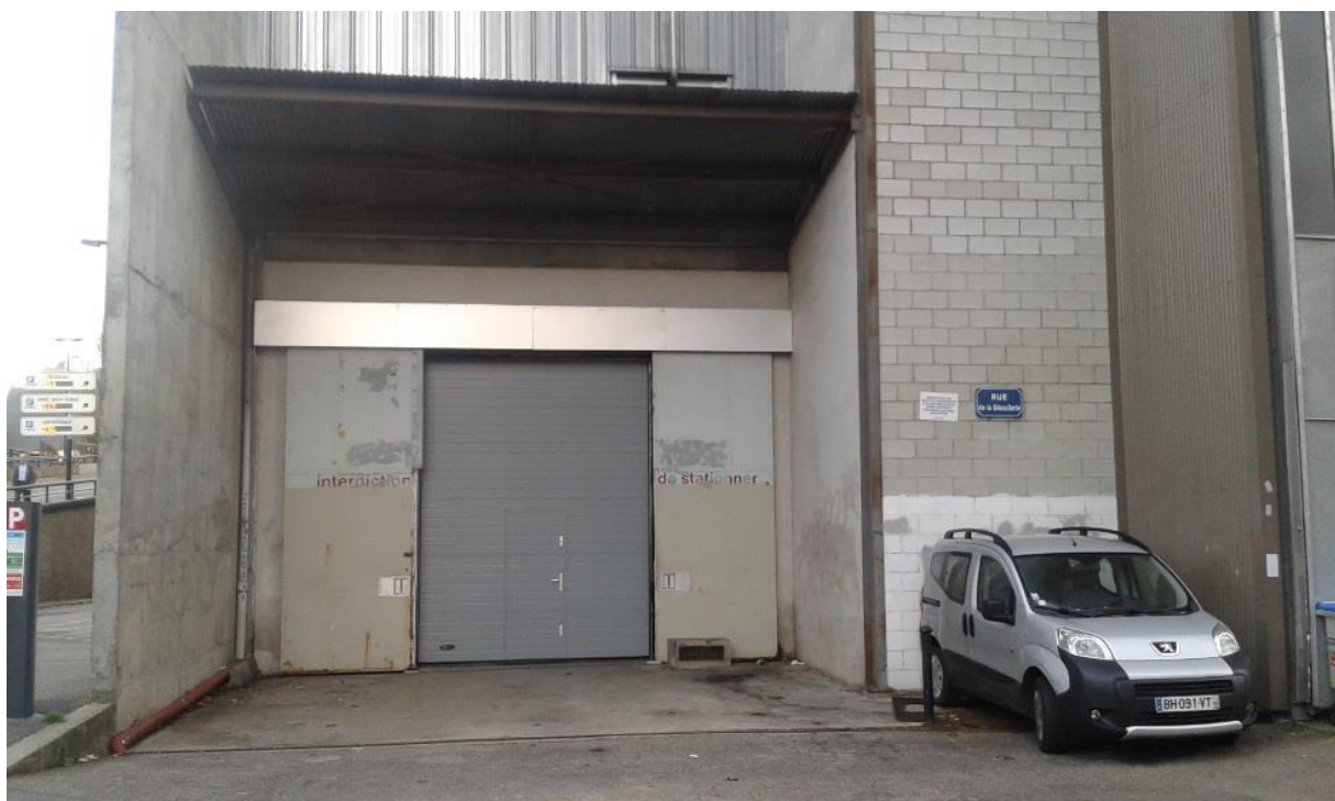
Dimension de l'accès décor : H=3,96m et L= 2,98m

Hauteur maximale des 2 allemandes : 7,70m