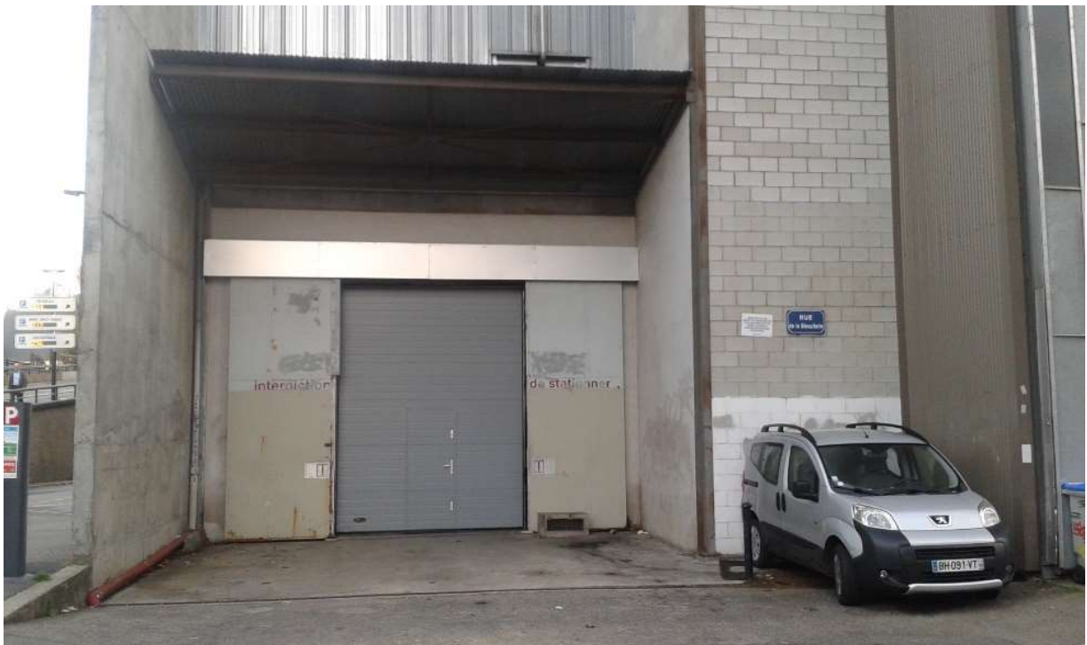
Dimension de l'accès décor : H=3,96m et L= 2,98m

Hauteur maximale des 2 allemandes : 7,70m